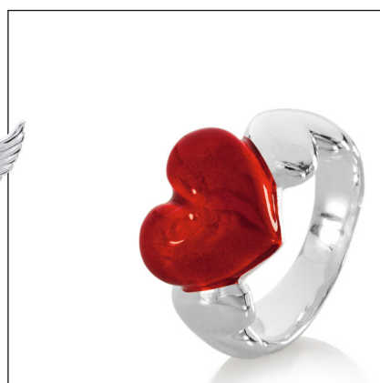
MY ONLY ONE