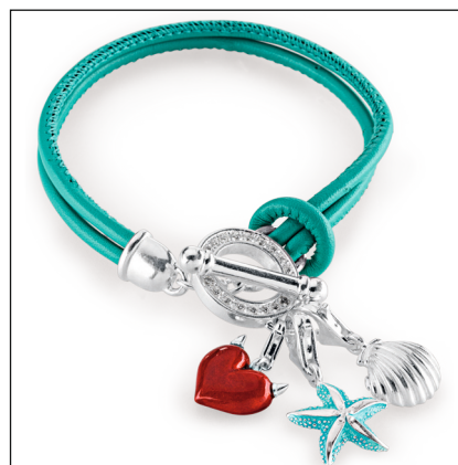
CHARMS OF SEALIFE