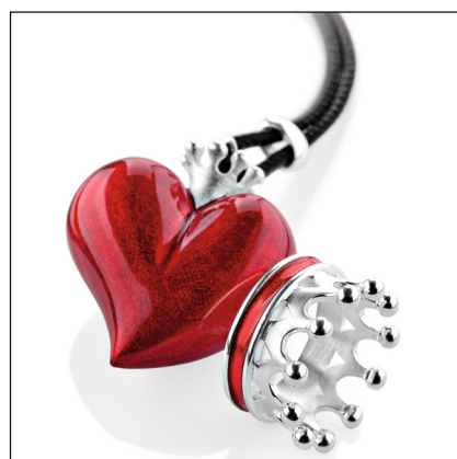
CROWN OF MY HEART

„My only one“ und „Crown of my heart“ befassen sich mit allen Herzensangelegenheiten, gebrochenen und beflügelten Herzen. Für alle Lebenssituationen ein besonderes Herz. Ob man dem Herz noch eine Krone aufsetzen oder einfach nur mal abheben und mitsamt seinem Herzen fliegen will, die Herzkollektionen sind so vielfältig wie die Liebe und die Frauen.